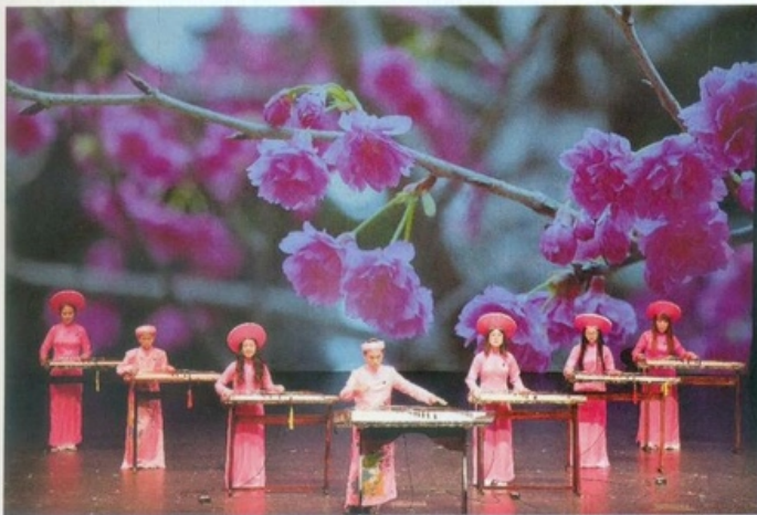
NS Hồng Việt Hải và đoàn văn nghệ dân tộc Hương Việt trong đêm 16.4 tại Seattle

Khi anh đọc những lời tri âm gửi đến khán giả kiều bào 15 năm qua đã xem ngôi nhà âm nhạc nghệ thuật Việt như một điểm lui tới thân thiết, tôi đã nhìn thấy anh khóc. Bởi, từng ấy năm anh hun đúc một giấc mơ, làm sao cho ngôi nhà này lớn hơn, có thêm nhiều thể hệ cùng anh nâng niu cội nguồn dân tộc trên xứ người. Seattle những ngày vào hè nắng ấm. Trăm hoa đua nở. Tiếng chim hót như mời gọi tâm hồn đồng điệu cùng đến với những đêm văn nghệ cộng đồng. Ai cũng đến dự với tâm trạng được thưởng thức những giai điệu âm nhạc ngũ cung, mà qua tiếng đàn tranh linh xương của anh, họ như thấy mình được gắn với quê hương hơn.