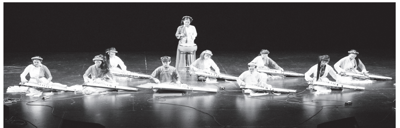
Dân ca “Hoa Thom Bướm Lượn”, đã được nhóm Hương Việt dùng để thay lời tạm biệt, kết thúc chương trình biểu diễn âm nhạc cổ truyền dân tộc Việt Nam tại lễ hội Folklife 2015.