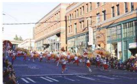
龙之队舞龙表演。(许且西雅图)

每年一度的中国城大巡游庆典活动,不仅是响应西雅图夏日海洋节的一个文化盛事,这早已成为西雅图华裔社区的传统庆典之一,也成为展现各族裔多元文化的平台。据悉,此次有超过60个团体参加游行表演,各个表演队伍都是来自社会各界,有着不同的文化背景,表演者年龄跨度也很大,从嗷嗷学步的幼儿到头发花白的老人,个个都饱含激情参加大巡游庆典。