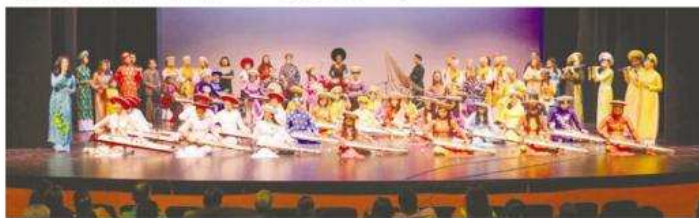
全体演出人员在台上表演。(美乐中文舞蹈学院)

最后的节目让观众和台上演职人员气氛融洽地进行了大合唱,把晚会推向了高潮。美乐学院的民族舞蹈节目为此次越南传统音乐庆典增添了丰富内容。越南艺术团团长洪越海在表演结束后向谢闻莺院长表示感谢。