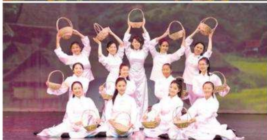
美乐中文舞蹈学院学生们正在表演采茶舞。